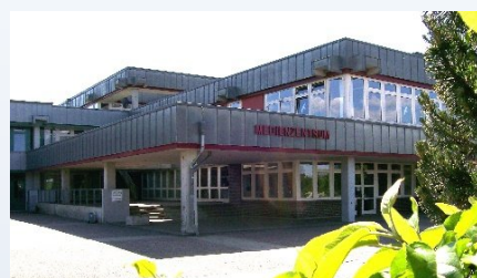
Das Medienzentrum des Landkreises Harburg im Schulzentrum Hittfeld