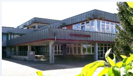
Das Medienzentrum des Landkreises Harburg im Schulzentrum Hittfeld

Medienpädagogischer Berater am Kreismedienzentrum Harburg